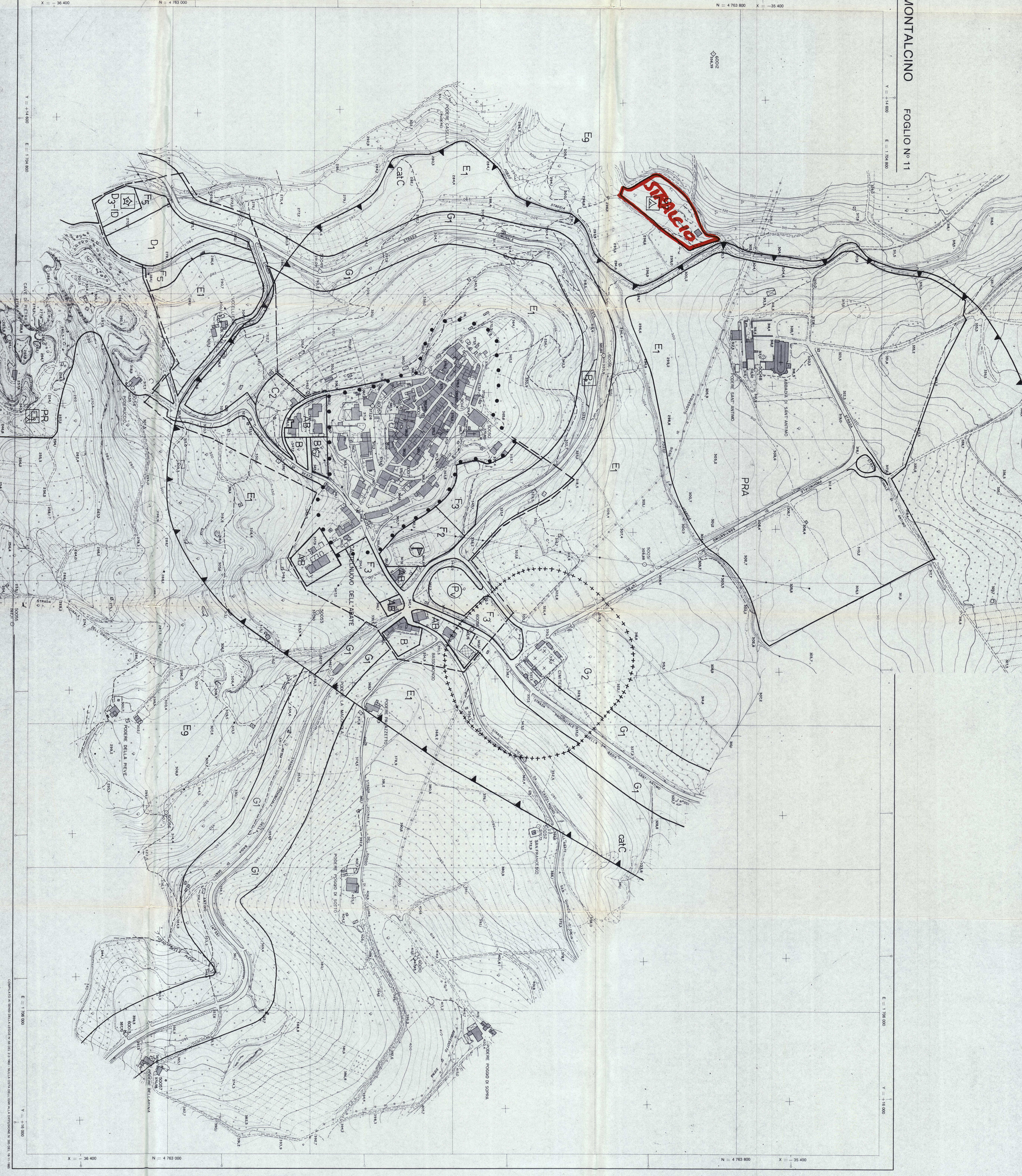
MONTALCINO FOLGIO N° 11

AMMINISTRAZIONE PROVINCIALE DI SIENA... Comune di MONTALCINO FOLGIO N° 11